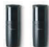
FT210 fotokomórki (para) nastawne z kątem 210°, zasięg 15 m