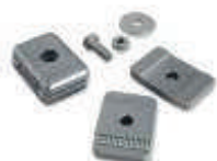
PLA 13 ograniczniki krańcowe mechaniczne przy otwieraniu i zamykaniu (4szt.)

inne dodatkowe akcesoria - patrz strony 66 - 73