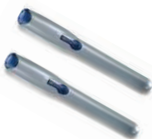
WG4000 2 siłowniki 230V