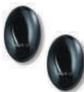
BF fotokomórka (para) zasięg 15-30m