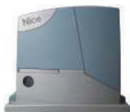
ROBUS350 silownik z wbudowaną centralą sterującą BLUEBUS