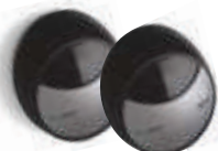
MOFB fotokomórki (para) BLUEBUS zasięg 15-30 m