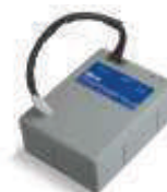
PS124 akumulator 24V 1.2 Ah z wbudowaną kartą ładowania