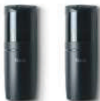
F210B fotokomórki (para) BLUEBUS, nastawne z kątem 210°, zasięg 15 m