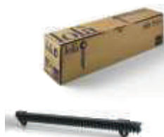
LOLA listwa zębata nylonowa M4, w odcinkach po 0,5 metra, pakowana po 10 sztuk, cena za 5 mb