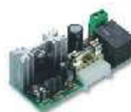
CARICA karta ładowania akumulatorów do siłownika RO1124