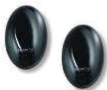
BF fotokomórki (para), zasięg 15 - 30 m